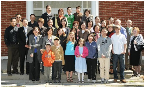
大合照 – Old Unionville Library