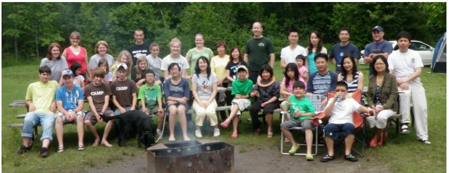
夏令退修野營 – Sibbald Point 郊野公園